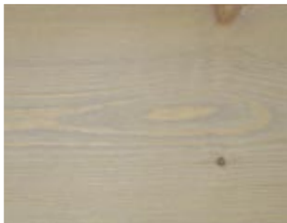
20 x 137 Grå Antismuss