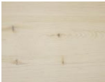
20 x 137 Hvit Antismuss